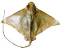
Myliobatis goodei Chucho