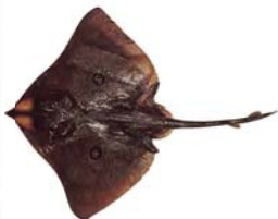
Atlantoraja cyclophora Raya de circulos