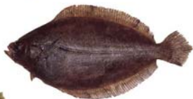
Xystreurys sp Lenguado