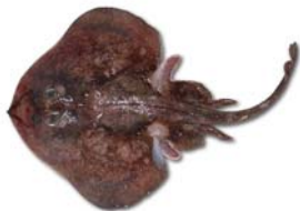
Psammobatis normani Raya