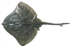
atlantoraja castelnaui Raya a lunares